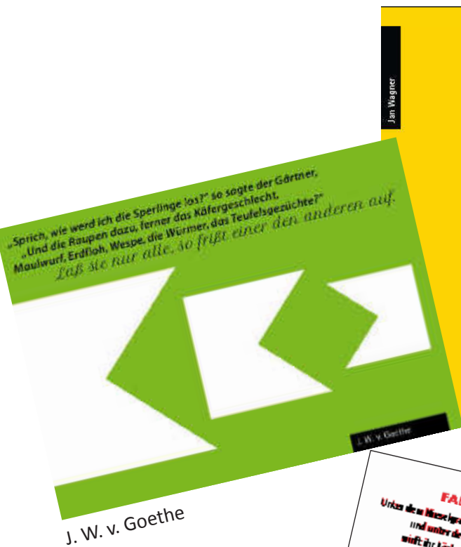
J. W. v. Goethe